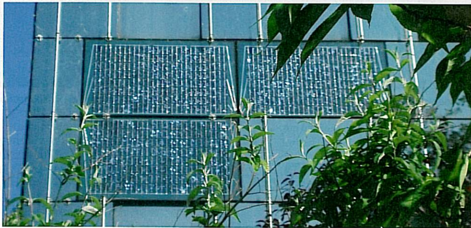
Stadtumbau West: Solarmodule am Gebäude Kaiserin-Augusta-Allee 108