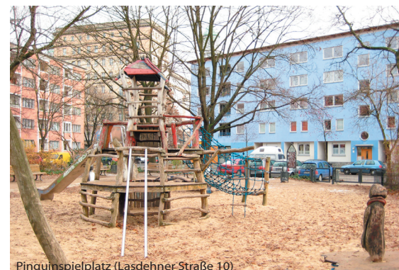
Pinguinenspielplatz (Lasdehner Straße 10)