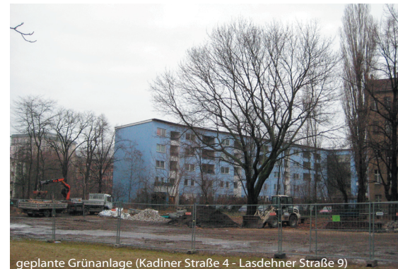
geplante Grünanlage (Kadiner Straße 4 - Lasdehner Straße 9)