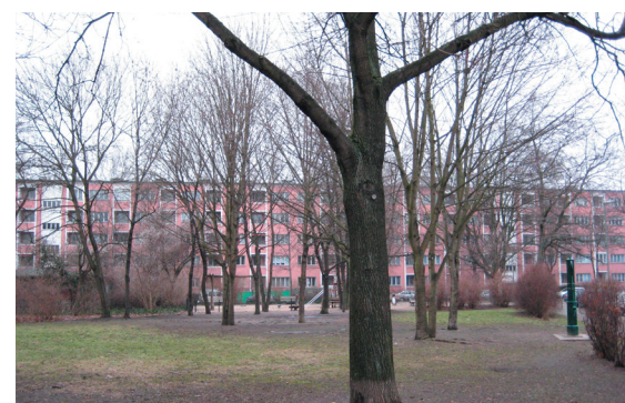
geplante Erweiterung des Pinguinenspielplatz (Lasdehner Straße 12)

Freitag, 20.03.2009 14:00 - 18:00 Freifläche Lasdehner Straße 12