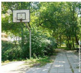
nicht nutzbare Spielbereiche

Gesamtinvestition bis 2022 ca. 1 Mio. Euro