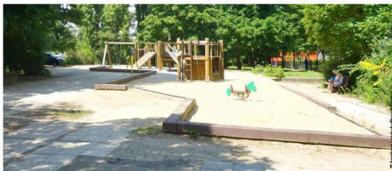
geringes Spielangebot für Kleinkinder und marode Oberflächen