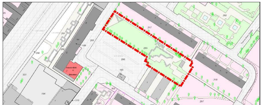
Lageplan: Spielplatz und Grünfläche

Neben den Hinweisen und Wünschen zur konkreten Spielplatzplanung wurden auch Anregungen für die angrenzenden Flächen aufgenommen, da sowohl die westlich gelegene Grünfläche mit der Bronzeskulptur "Mädchen mit Katzen" und der Wiese als auch der östlich gelegene "Tischtennisplatz" neu gestaltet werden sollen.