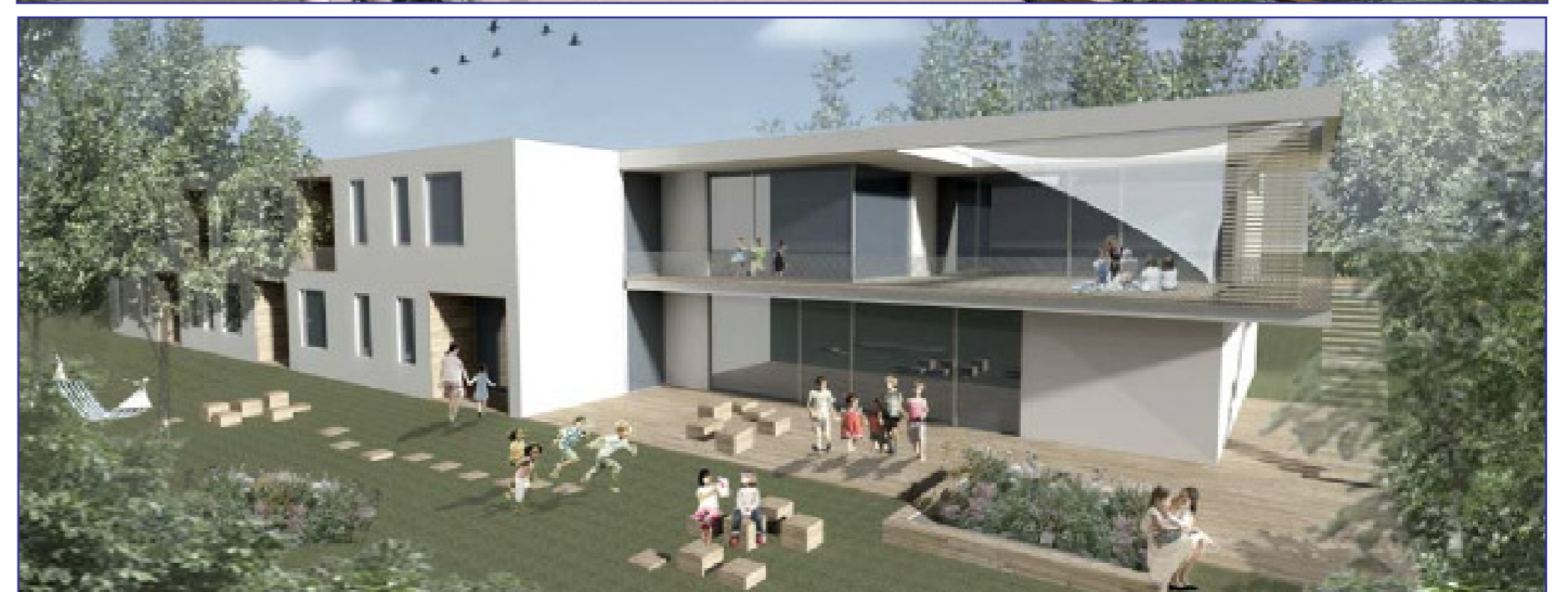
Entwurf für den Blick vom Stadteilpark Mittelfeldbecken