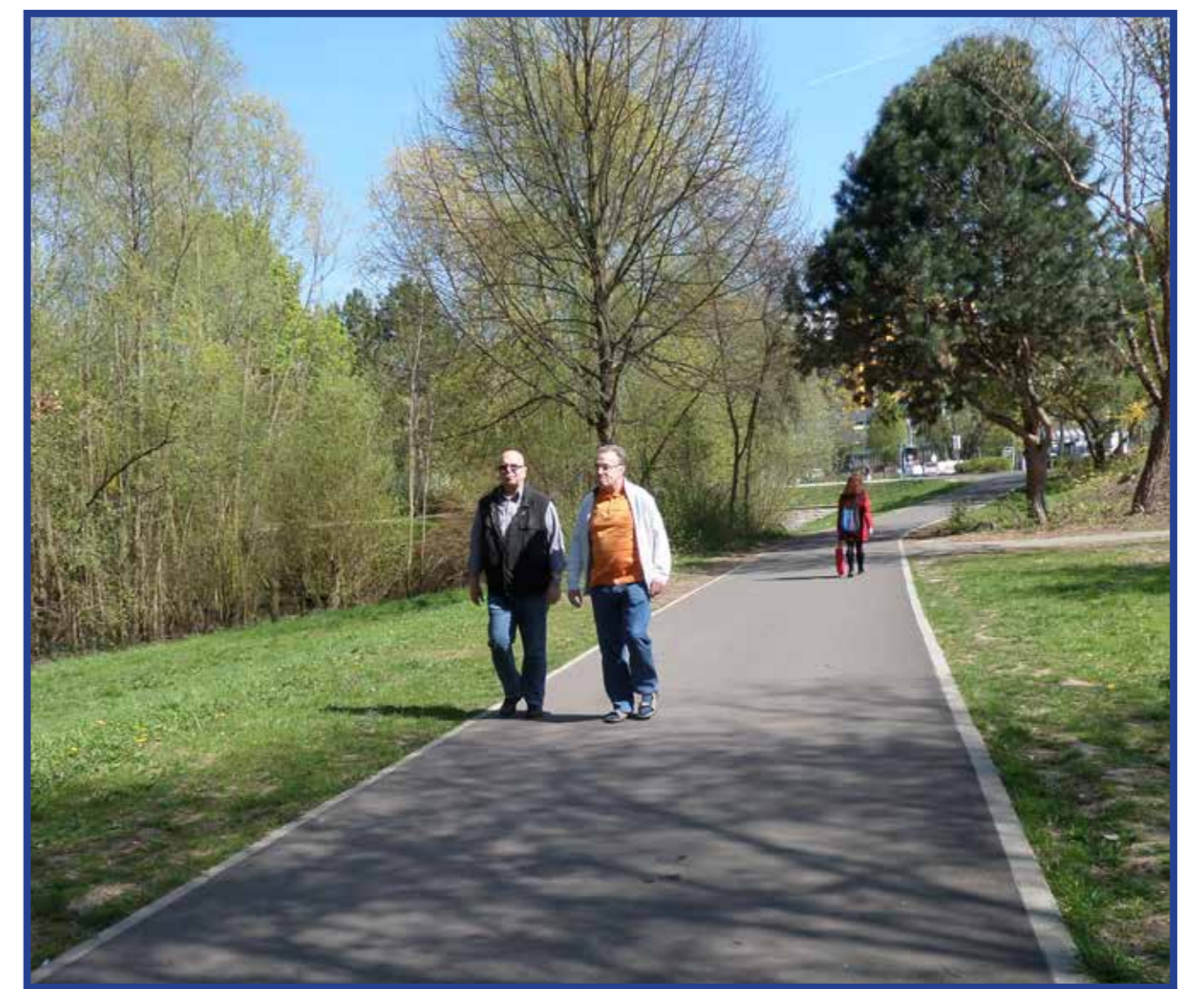
Erneuerter Weg entlang des Packereigrabens