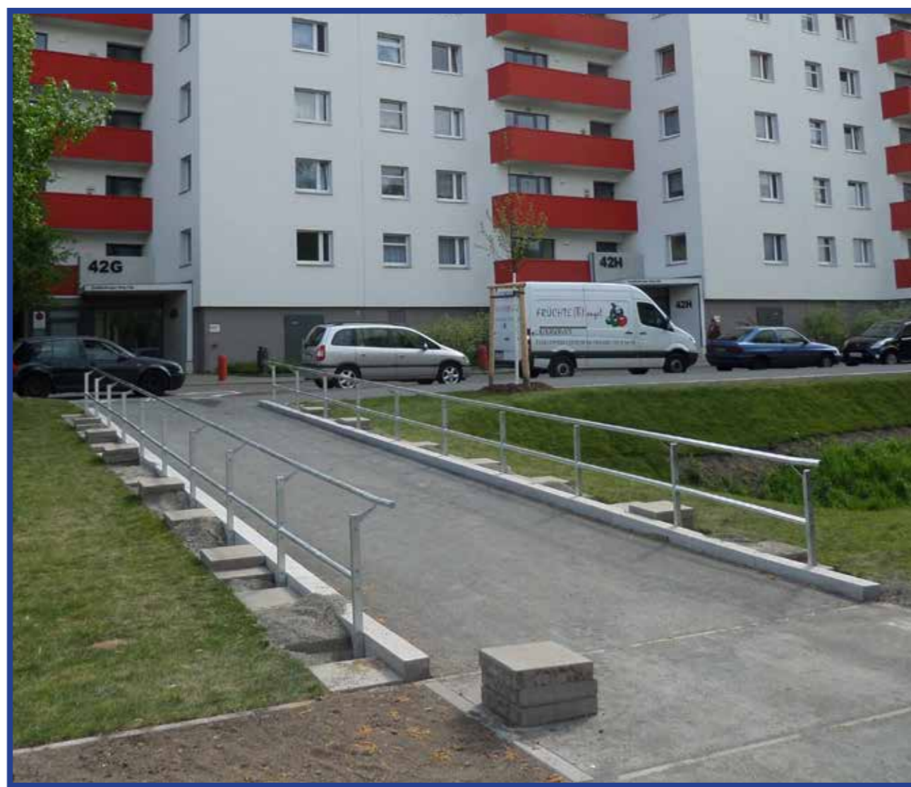
Neue Querung des Bruchstückengrabens

Die Planung erfolgte durch das Landschaftsarchitekturbüro Frank von Bergen. In den kommenden Jahren sollen weitere Aufwertungsmaßnahmen, wie z.B. am östlichen Ufer des Seggeluchbeckens sowie entlang des Gandenitzer Weges, erfolgen.