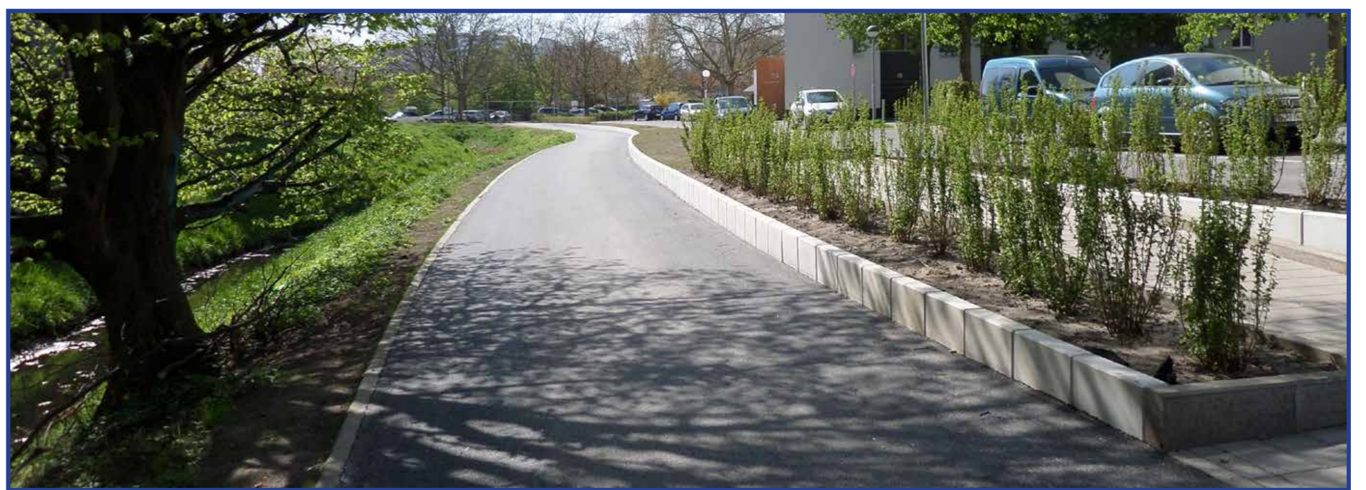
Begrünter Rad- und Fußweg am Eichhorster Weg