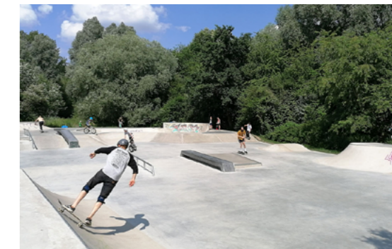
5 Im Juni 2020 wurde die qualifizierte Skateranlage in der Wolfgang-Hein-Straße in Buch fertiggestellt und zur Nutzung frei gegeben.