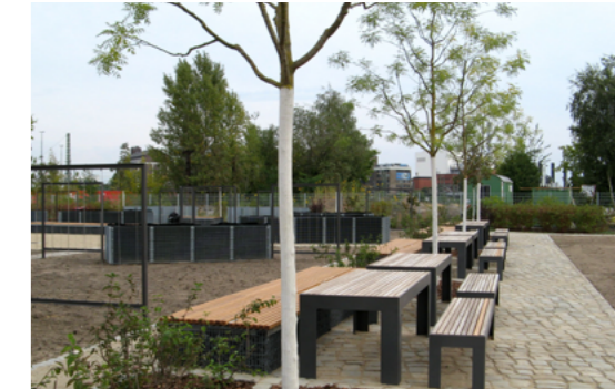
4 Der Stadtgarten Moabit wurde 2007 bis 2012 zu einer vielfältig nutzbaren Grünanlage umgebaut.