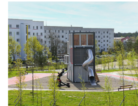
2 IGA elektropolis, Marzahn-Hellersdorf