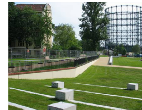
3 Der neugeschaffene Park „GASAG Nordspitze“ ist Teil des Grünzugs der sogenannten Schöneberger Schleife. Er wurde 2009 fertiggestellt.