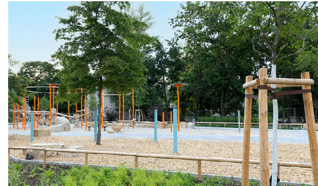
1 Der neue Spielplatz Halemweg ist eingebunden in die Grünverbindung Halemweg-Popitzweg, die unter dem Motto „Grün ohne Grenzen“ umgeplant wird.