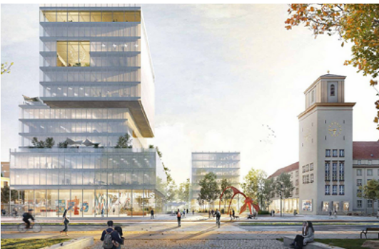
4 Perspektive: Blick auf den Tempelhofer Platz mit Rathaus, Rathausenerweiterung und dem neuen Kultur- und Bildungsbaustein © TeleInternetCafe mit Treibhaus Landschaftsarchitektur Hamburg (Visualisierung Jonas Bloch)