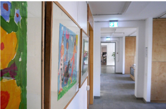
5 Die Jugendkunstschule Lichtenberg wurde von 2017 bis 2019 energetisch und baulich modernisiert. Sie ist ein wichtiger Anker für das Quartier