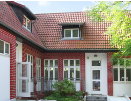
2 Das Familienzentrum am Heckerdamm ist jetzt in einem ehemaligen Gebäude des Grünflächenamtes untergebracht, das 2017 für die neue Nutzung umgebaut wurde.