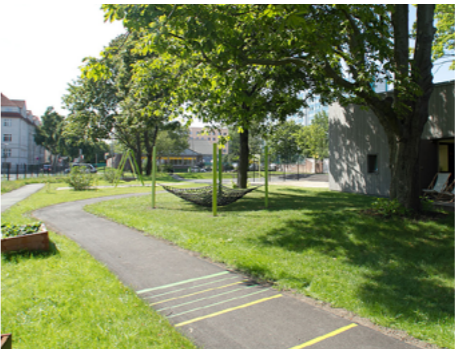
3 Weitläufige Sport- und Spielflächen, Platz zum Gärtnern und Erholen in der Kinder- und Jugendfreizeiteinrichtung Gotlindestraße im Fördergebiet Frankfurter Allee Nord