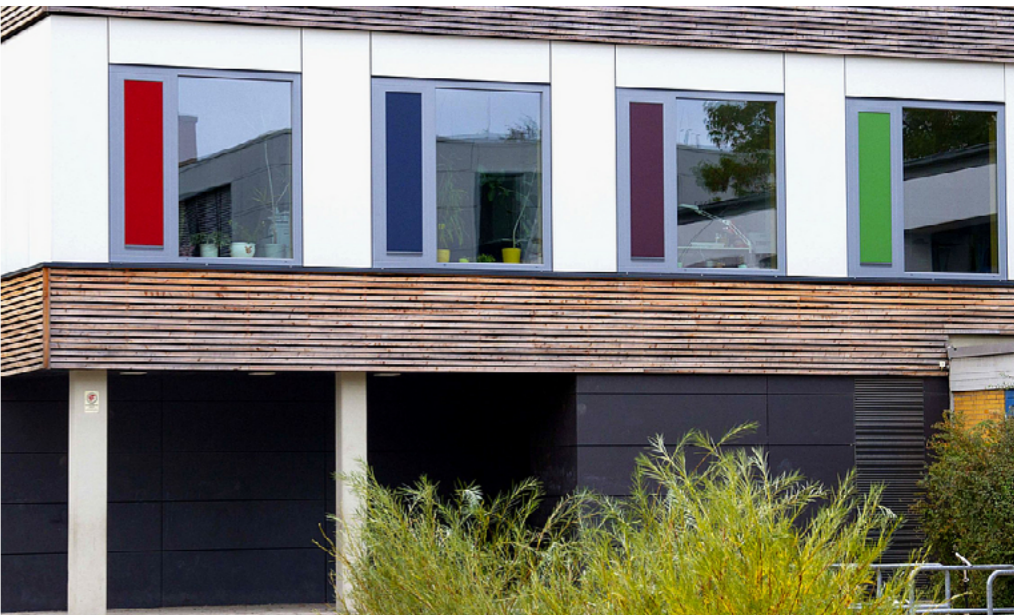
1 Die ehemalige Bibliothek in der Westerwaldstraße wurde zu einem Beratungsgebäude für den Kinder- und Jugendgesundheitsdienst sowie den Regionalen Sozialen Dienst umgebaut.