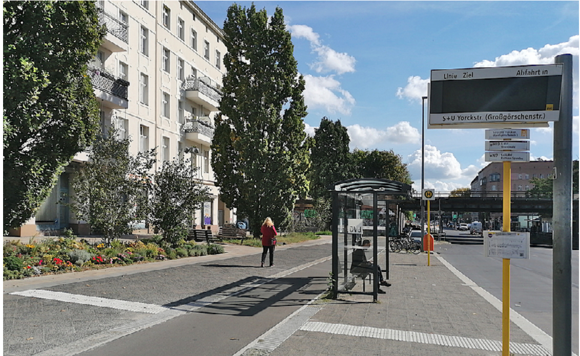
Der neue westliche Vorplatz der Yorckbrücken nach der Sanierung 2022